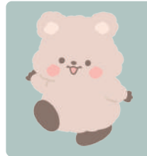
행복한 퀘카 시루