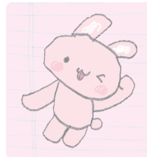
행복에 신난 토깽씨