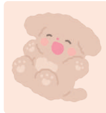
인싸 댕댕이 초코