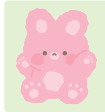
솜사탕 토끼 캔디