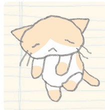
피곤에 지친 고양이