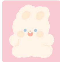
크림 토끼 슈슈