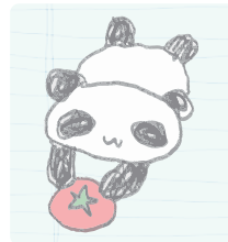
똥구락 늘어진 판다씨