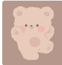
수줍은 상담가 쿠키