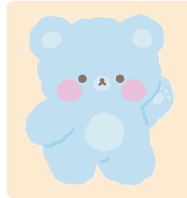
솜사탕 곰돌이 코튼